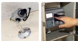
各所に監視カメラ、 指紋認証を設置