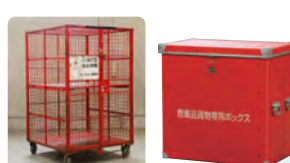
施錠可能な 専用輸送機材