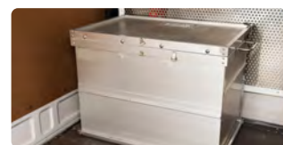
配達車両内では専用BOXへ 格納、又は積分けを行い、 一般貨物との混在を防止