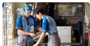
チェック表を用いた 貨物確認の実施