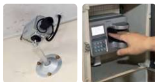
各所に監視カメラ、 指紋認証を設置