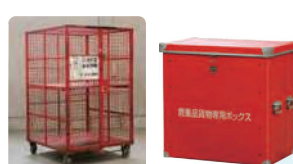
施錠可能な 専用輸送機材