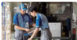
チェック表を用いた 貨物確認の実施