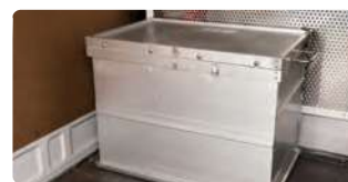
配達車両内では専用BOXへ 格納、又は積分けを行い、 一般貨物との混在を防止